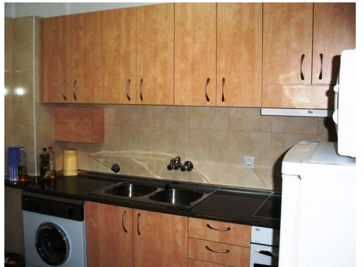
Salón con sofá-cama matrimonio (convertible en habitación para urgencias en caso de estar el piso completo) Cocina totalmente equipada con lavadora, frigorífico, microondas, horno, vitrocerámica... 2 Baños completos.