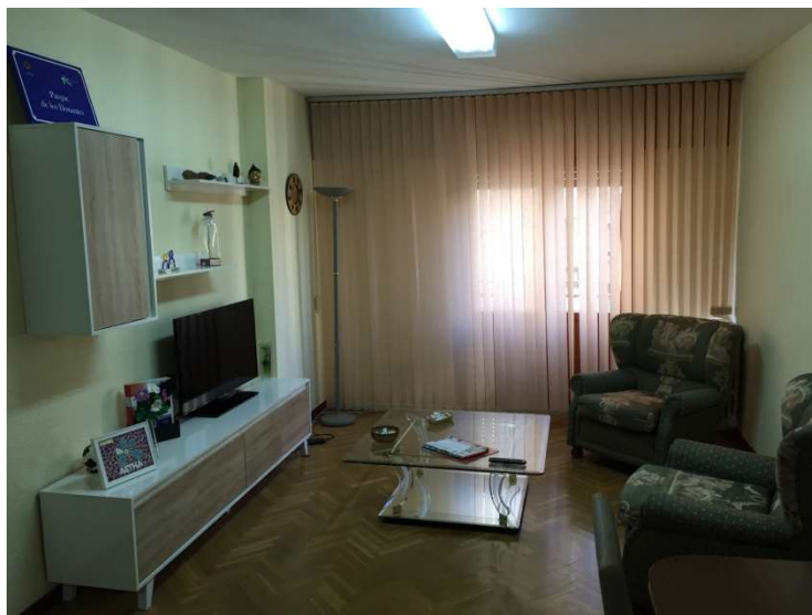
Entrada principal y gran salón-comedor con capacidad para la estancia de varias familias.