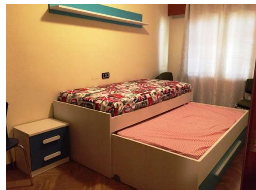
Imágenes de varias de las habitaciones con la que cuenta el piso de acogida.