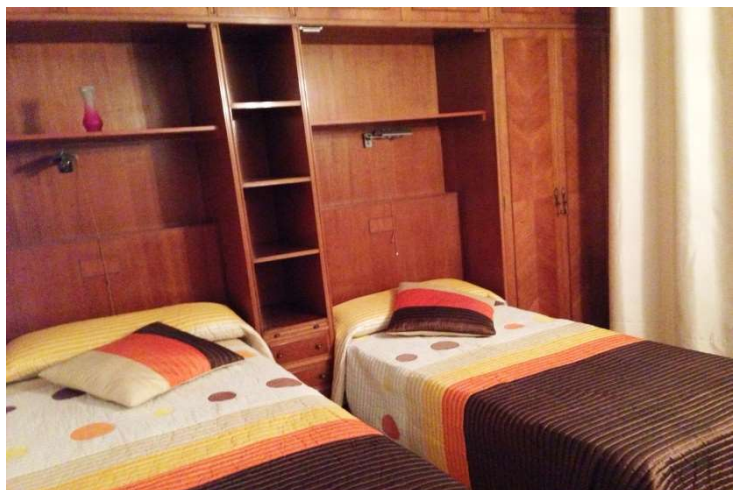
Los dormitorios tienen dos camas, sus armarios, escritorio y televisiones individuales